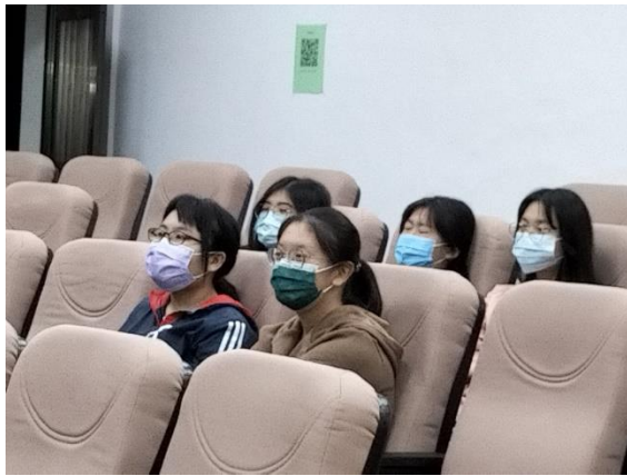
生科系邱同學與黃同學專注聽講