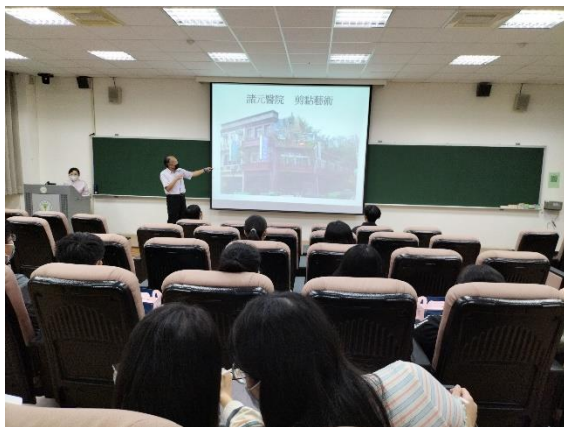
講師介紹北港 66 處在地風景之