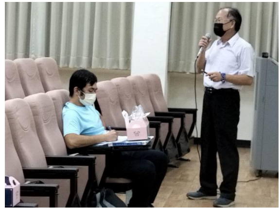
物治系蘇同學認真作筆記