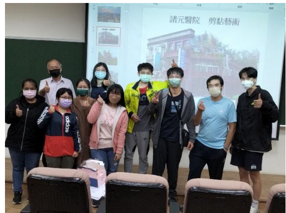
會後部分學生與講師合影