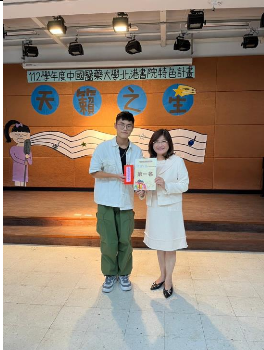
圖說:第一名同學與評審合影