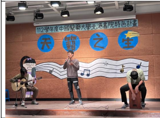
圖說:同學表演留影