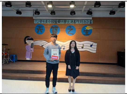
圖說:佳作同學與評審合影