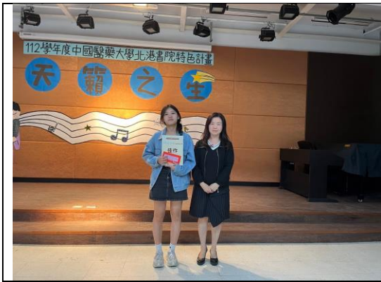
圖說:佳作同學與評審合影