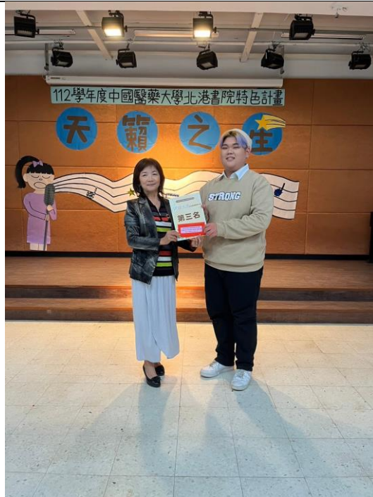
圖說:第三名同學與評審合影