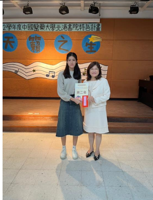
圖說:第二名同學與評審合影