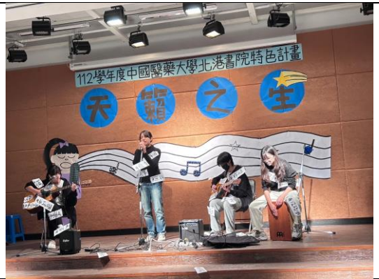
圖說:佳作同學表演留影