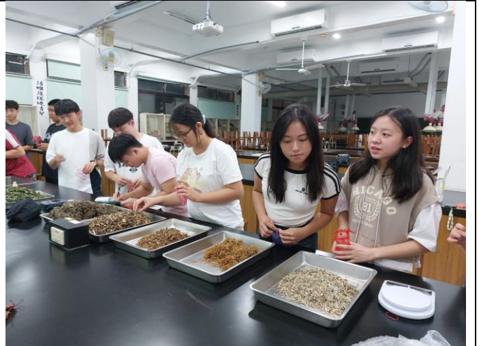
圖說:同學們挑選自己喜歡的中草藥材製作香囊