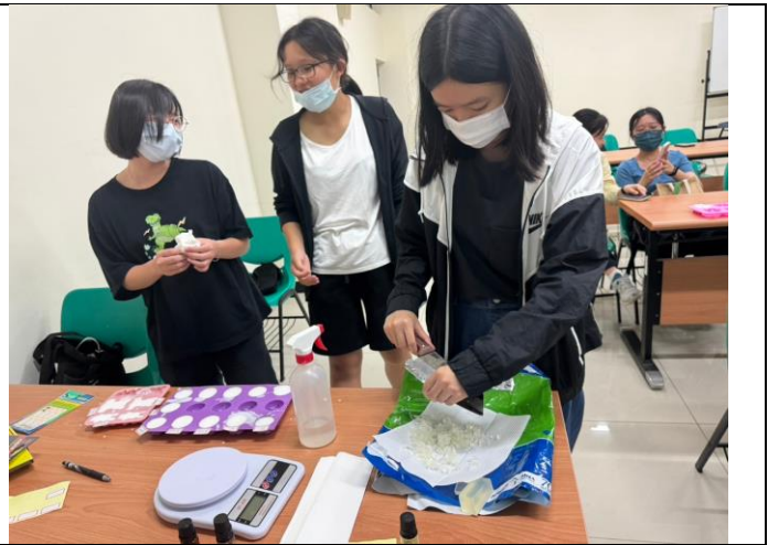
同學們將調和後之皂基倒入不同圖樣的皂模中