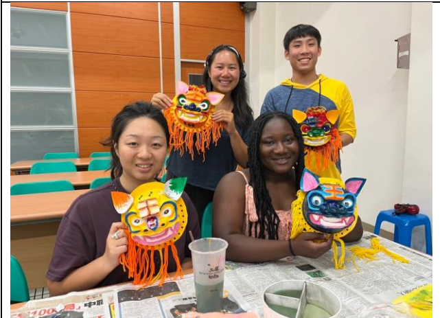
CMU feat. Fulbright 彩繪獅頭活動合影