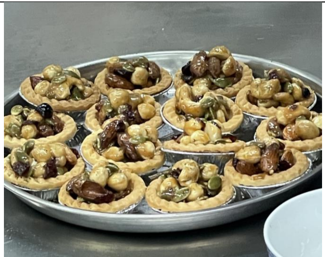
薄荷堅果塔成品照片