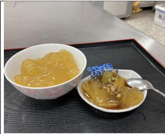
天然粉粿加上自煮綠豆湯和黑糖水成品