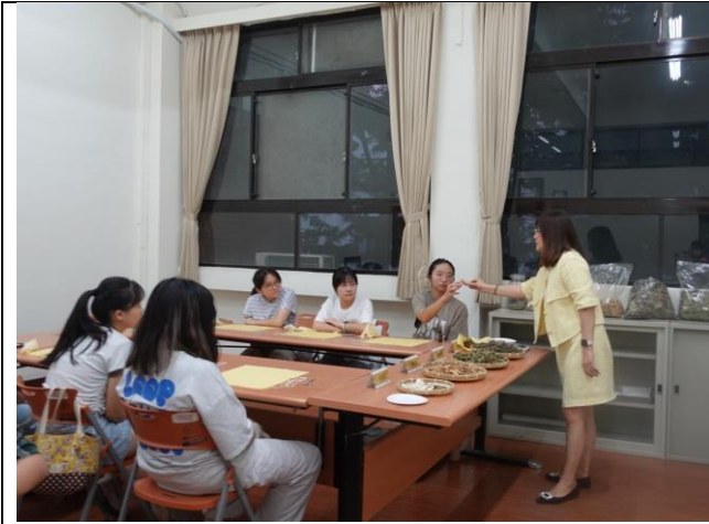
圖說:授課講師引導學生實地認識藥材