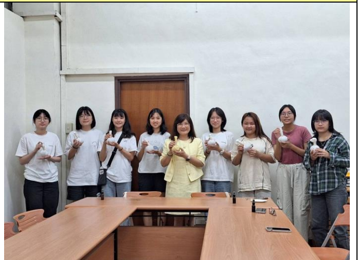
圖說：舒活藥草球成果合影