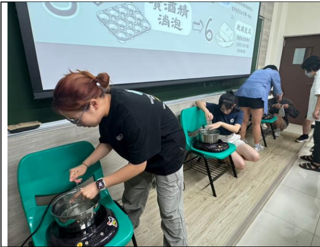
同學們先融化皂基後再添加天然中草藥材