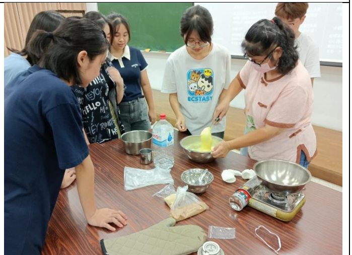
分部同仁與同學們一同製作天然粉粿