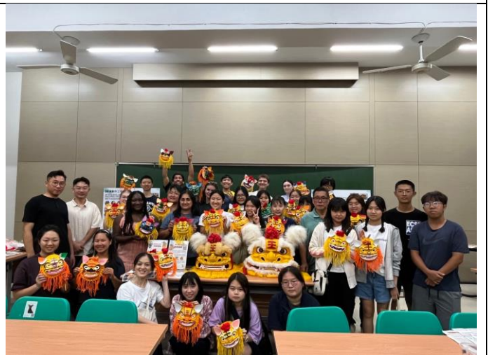
CMU feat. Fulbright 彩繪獅頭活動全體合影