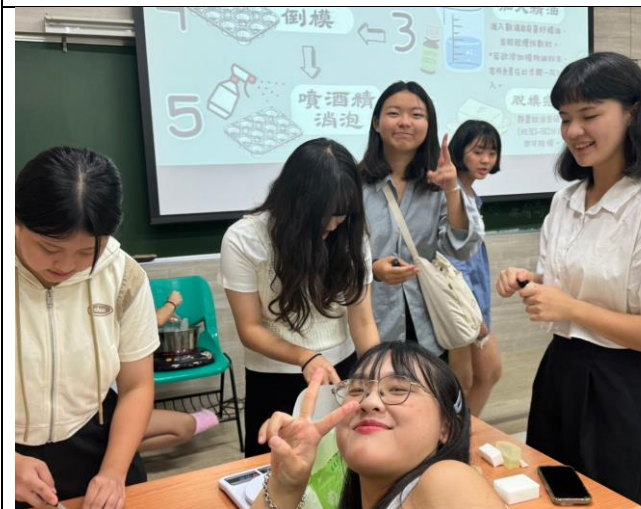
學生DIY製作手工香皂開心合影