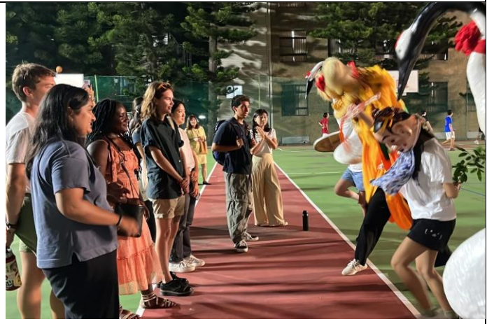
白鶴獅陣團員為 Fulbright 現場精彩演出