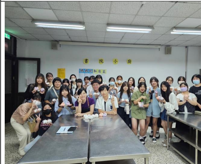
烘焙課程結束後全體師生合影留念