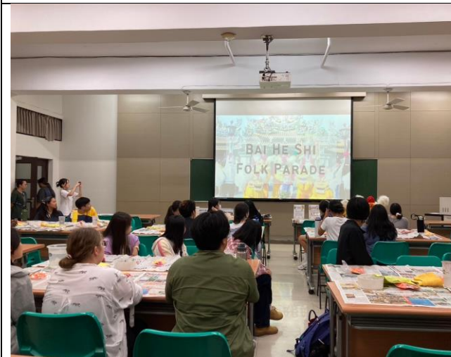
白鶴獅陣學生自製英文簡報向外國友人介紹