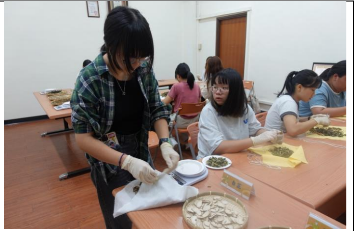
圖說:舒活藥草球學生調配藥材製作體驗