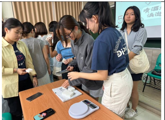
參與手工皂製作的同學由皂基