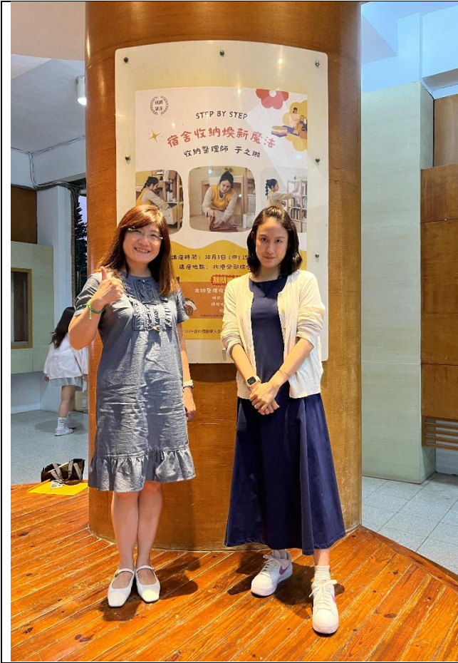
圖說：北港分部師長與講師於史懷哲合影