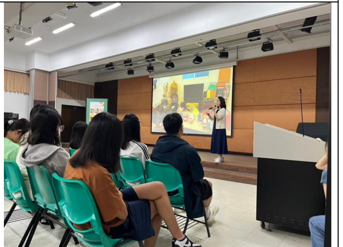
圖說: 講者以實際收納案例之前後對照啟發同學