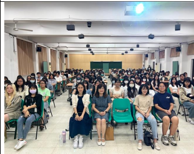
圖說: 講師與全體參與同學合影