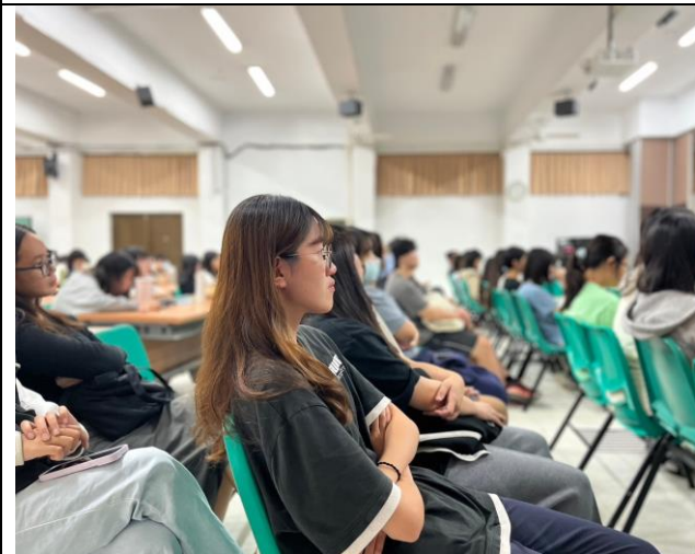
圖說: 講座現場幾乎滿座，學生反應良好