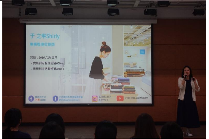
圖說: 講者有豐富校園演講及居家收納實務經驗