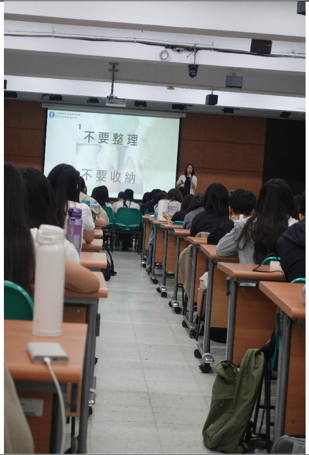
圖說：居家整潔是物歸定位，而不是反覆整理