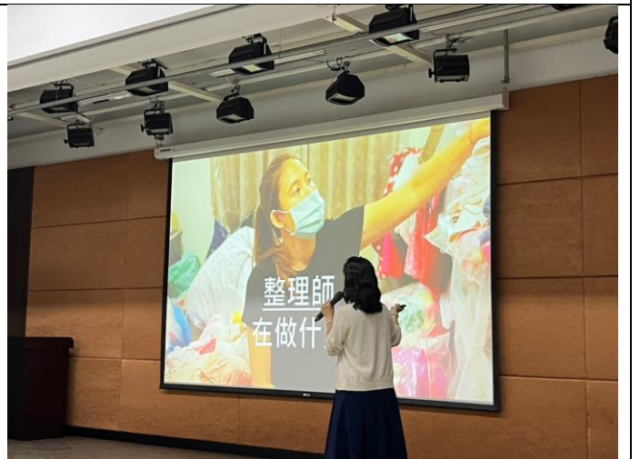
圖說: 講者為大家介紹居家整理師與打掃的不同